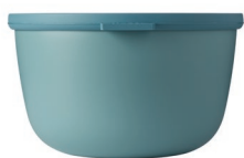
Bouteille d'eau Ellipse et bol multi-fonction Cirqula